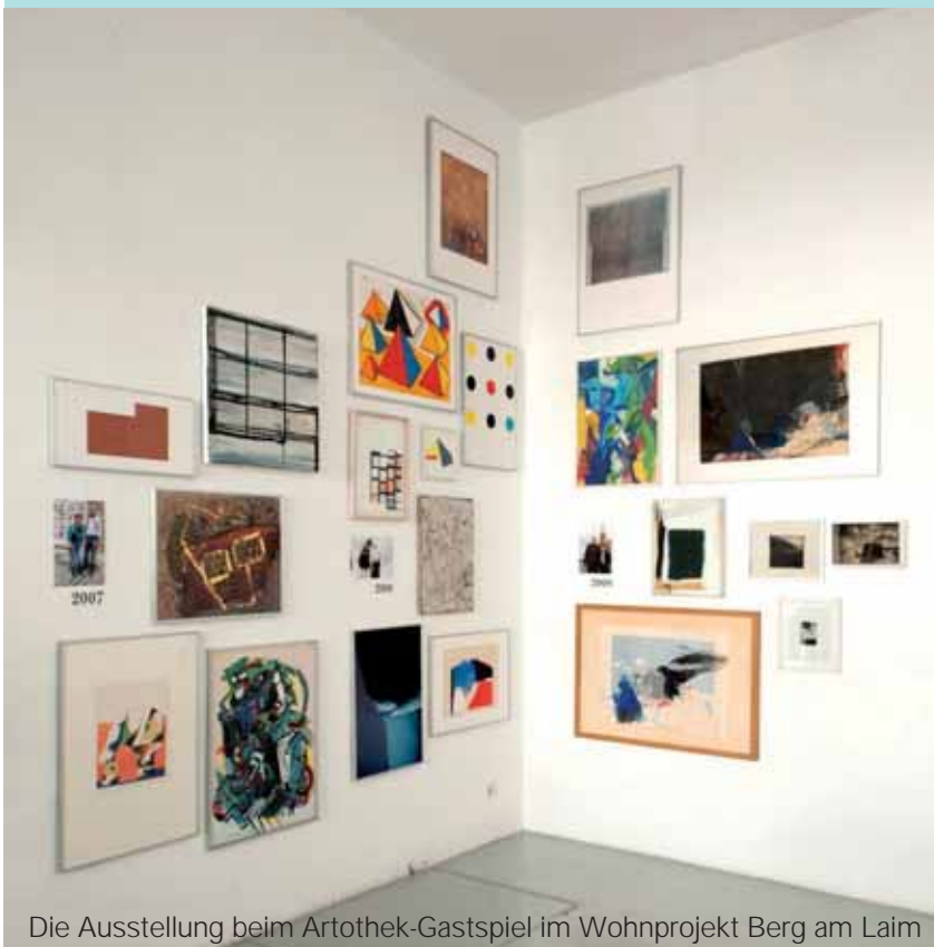
Die Ausstellung beim Artothek-Gastspiel im Wohnprojekt Berg am Laim