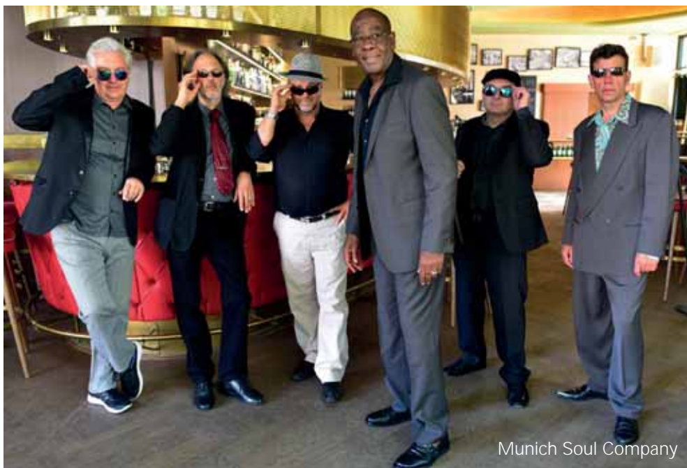
Munich Soul Company