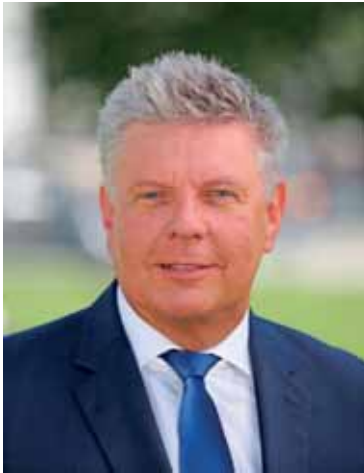
Oberbürgermeister Dieter Reiter